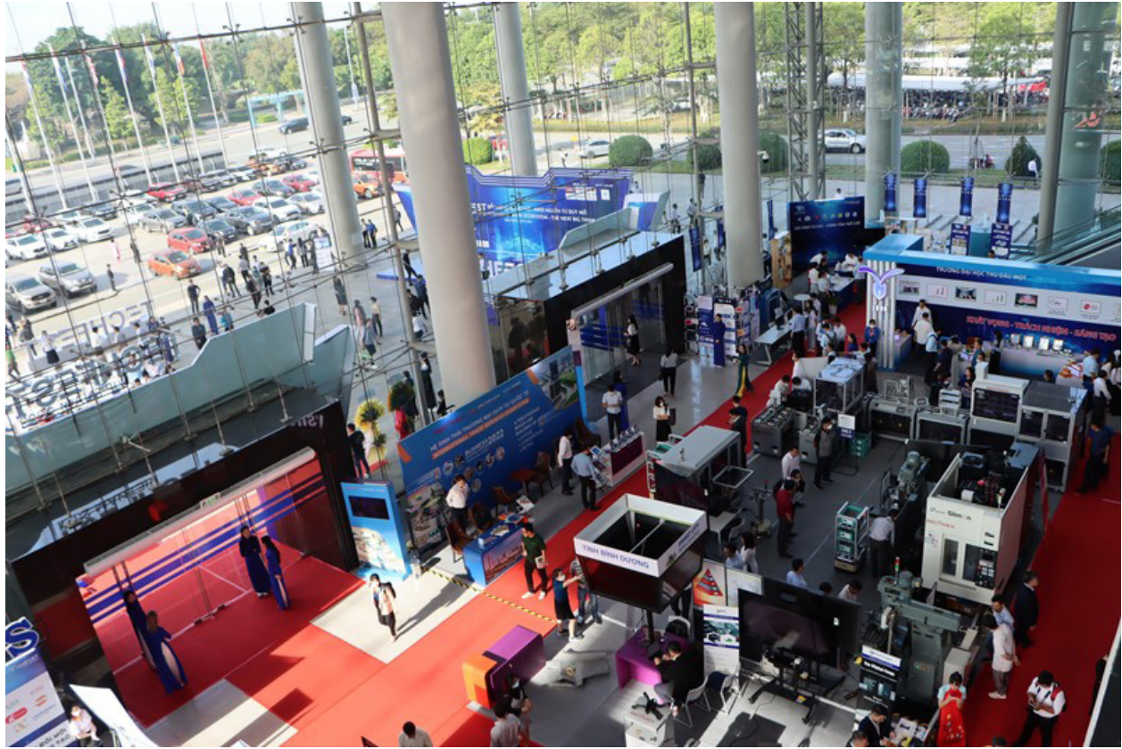
Các doanh nghiệp tham gia triển lãm bên lễ Techfest Việt Nam được tổ chức tại Bình Dương

Trong phát triển doanh nghiệp KH&CN, đến nay toàn vùng Đông Nam bộ đã cấp giấy chứng nhận doanh nghiệp khoa học và công nghệ cho 141 doanh nghiệp; 104 doanh nghiệp khởi nghiệp thuộc các lĩnh vực công nghệ được khuyến khích phát triển, trong đó chủ yếu là công nghệ sinh học (chiếm 39,9%), công nghệ tự động (25,5%), công nghệ thông tin (17%), vật liệu mới (10%). Các doanh nghiệp khoa học và công nghệ chú trọng tới đầu tư cho hoạt động nghiên cứu và phát triển, đổi mới công nghệ nhằm nâng cao năng suất, chất lượng sản phẩm.