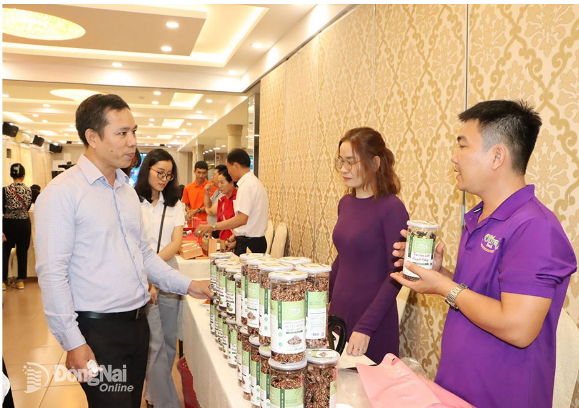
Các doanh nghiệp tham gia Hội nghị Kết nối sản phẩm khởi nghiệp, đổi mới sáng tạo với hệ thống phân phối tại Đồng Nai năm 2023

lập nghiệp. Đối với xây dựng hệ sinh thái đổi mới sáng tạo và khởi nghiệp của thanh niên, Tỉnh đoàn đã được sự cho phép về chủ trương của Tỉnh ủy để nghiên cứu thành lập Trung tâm Đổi mới sáng tạo khởi nghiệp của Đoàn. Từ đó kết nối với các hệ sinh thái, cụ thể là các quỹ đầu tư khởi nghiệp, đội ngũ chuyên gia cho cộng đồng khởi nghiệp, hoạt động hội thảo, diễn đàn,