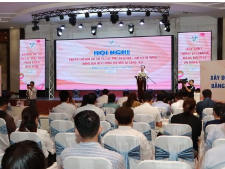
Quang cảnh hội nghị

T hực hiện các hoạt động chào mừng Ngày Sở hữu trí tuệ thế giới (26/4) năm 2024, sáng ngày 24/4, tại Trung tâm hội nghị Golden Place (thành phố Biên Hòa), Sở Khoa học và Công nghệ (KH&CN) tỉnh Đồng Nai đã tổ chức hội nghị “Gắn kết sở hữu trí tuệ và các mục tiêu phát triển bền vững thông qua hoạt động đổi mới và sáng tạo”.