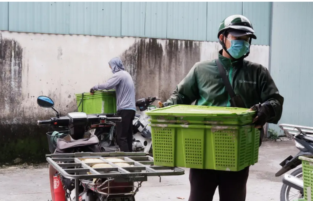
Shipper đang giao sản phẩm của Kamereo