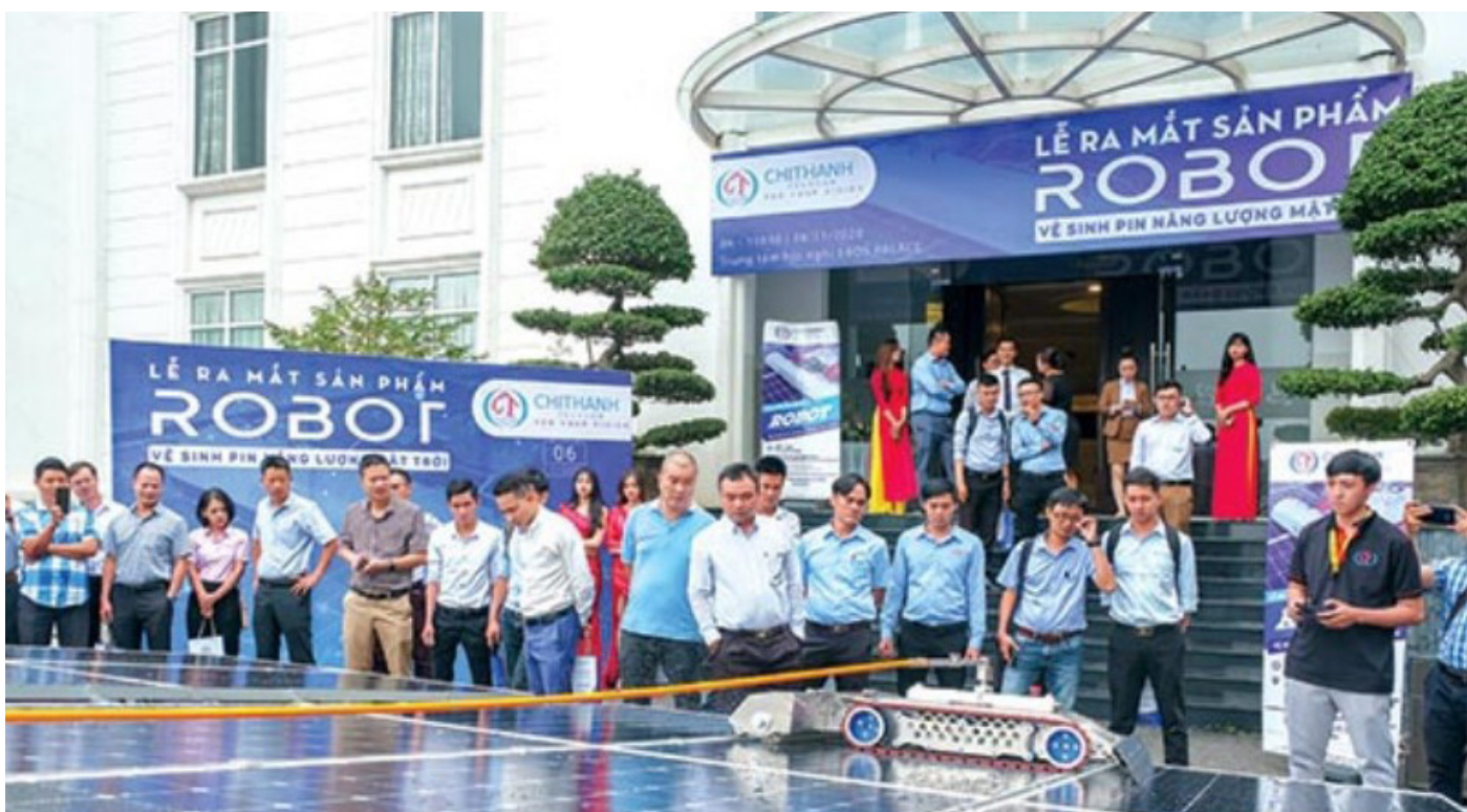
Giới thiệu sản phẩm Robot vệ sinh năng lượng mặt trời của Công ty TNHH Công nghệ viễn thông Chí Thanh, một doanh nghiệp khởi nghiệp ngành công nghệ ở Đồng Nai

lớn đối với xã hội và kinh doanh. Điều này thúc đẩy sự xuất hiện của các doanh nghiệp có mục tiêu xã hội và khởi nghiệp xanh, nhằm giải quyết những thách thức này thông qua các giải pháp sáng tạo và bền vững.