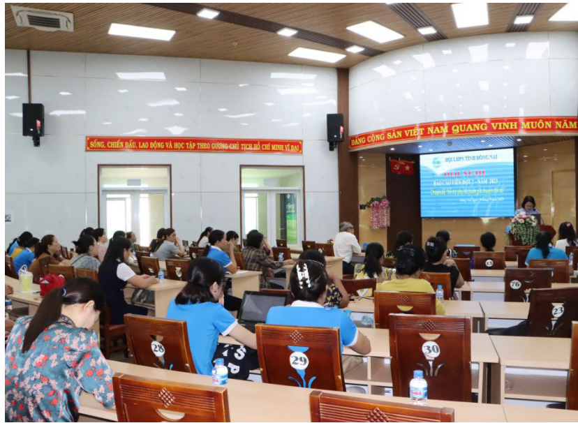
Tập huấn kiến thức ứng dụng công nghệ hỗ trợ phụ nữ khởi nghiệp

Ngoài ra, trong thời gian qua, Đồng Nai cũng đã hỗ trợ doanh nghiệp do phụ nữ làm chủ tham gia Đề án Đổi mới phương thức kinh doanh tiêu thụ nông sản giai đoạn 2021-2025 định hướng đến năm 2030. Theo đó, lựa chọn doanh nghiệp sản xuất, kinh doanh sản phẩm nông nghiệp trên địa bàn huyện Vĩnh Cửu – Công ty TNHH Hương, do phụ nữ làm chủ là chủ thể chính, hỗ trợ doanh nghiệp hoàn thiện chuỗi hiện có và đẩy mạnh phân phối qua các kênh phân phối hiện đại, tại các bếp ăn tập thể trên địa bàn tỉnh.