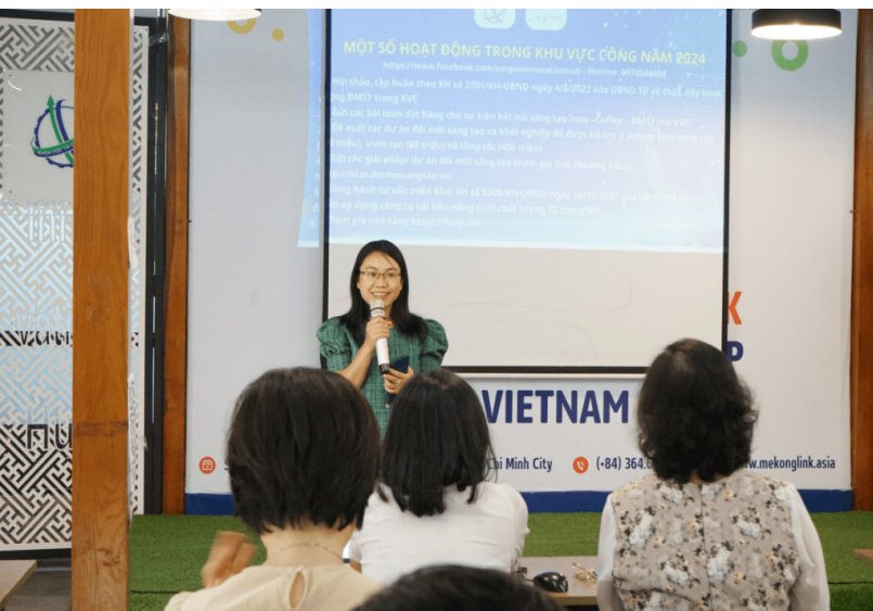
Hoạt động tại khóa đào tạo

Vừa qua, hơn 40 đại diện là các cán bộ ban ngành, doanh nghiệp nhà nước, đơn vị nghiên cứu công lập, dưới sự điều phối của Chương trình Phát triển liên hợp quốc (UNDP) Việt Nam và Trung tâm Trung tâm Hỗ trợ khởi nghiệp sáng tạo Quốc gia (NSSC) đã tham gia khóa đào tạo về Nâng cao năng lực đổi mới sáng tạo trong Khối công thức đẩy giảm thiểu ô nhiễm nhựa diễn ra 02 ngày 26 – 27/02/2024 tại Trung tâm Ứng dụng Tiên bộ Khoa học và Công nghệ TP.Hồ Chí Minh (SIHUB).