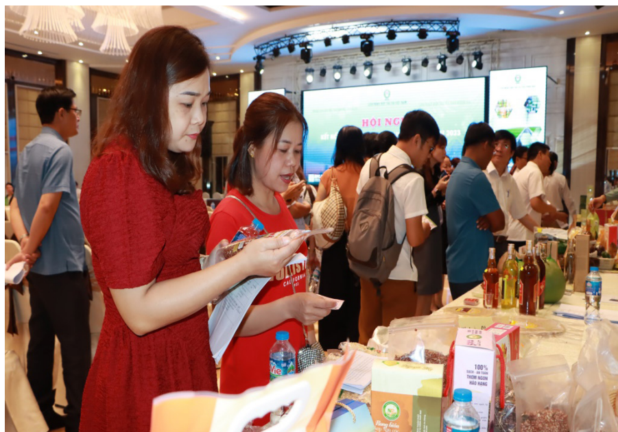
Các doanh nghiệp, HTX tìm hiểu về thông tin sản phẩm tại Hội nghị kết nối cung – cầu do Liên minh HTX tổ chức

Tài liệu, hồ sơ liên quan đến nội dung đề xuất hỗ trợ DNNVV quy định nộp cho cơ quan, tổ chức hỗ trợ DNNVV là bản sao hoặc bản chụp từ bản gốc, bản chính và không cần chứng thực. Trường hợp cần thiết, cơ quan, tổ chức hỗ trợ DNNVV đề nghị DNNVV cung cấp bản chính hoặc bản gốc để đối chiếu thông tin.