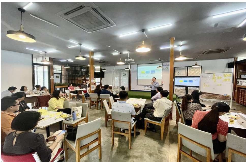
Hơn 40 đại diện là các cán bộ ban ngành, doanh nghiệp nhà nước, đơn vị nghiên cứu công lập, dưới sự điều phối của Chương trình Phát triển liên hợp quốc (UNDP) Việt Nam và Trung tâm Trung tâm Hỗ trợ khởi nghiệp sáng tạo Quốc gia (NSSC) đã tham gia khóa đào tạo

Tại hội nghị, đại diện Saigon Innovation Hub đã giới thiệu một số hoạt động khởi nghiệp sáng tạo, đổi mới sáng tạo trong khu vực công sẽ triển khai trong năm 2024. Bà cũng mong rằng trong thời gian tới TP Hồ Chí Minh sẽ có thêm nhiều chương trình thiết thực từ các đối tác trong và ngoài nước cho khu vực công.