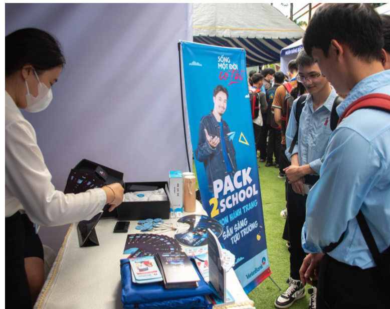
Hỗ trợ doanh nghiệp trung bày giới thiệu sản phẩm khởi nghiệp

Đối tượng áp dụng là doanh nghiệp được thành lập, tổ chức và hoạt động theo quy định của pháp luật về doanh nghiệp và đáp ứng các quy định tại Chương II Nghị định số 80/2021/NĐ-CP về tiêu chí xác định DNNVV.