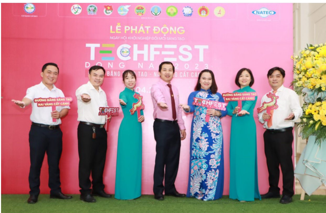
Sở KH&CN phát động Chương trình Techfest năm 2023