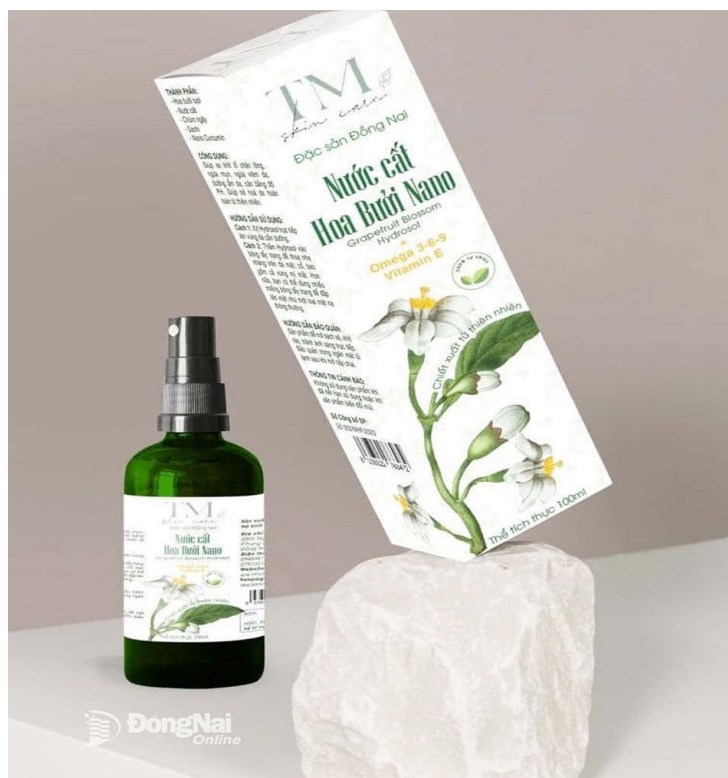
Sản phẩm nước cất hoa bưởi

thủ công nên mùi của sản phẩm dễ bị biến đổi, không bảo quản được lâu (chỉ khoảng 3 tháng).