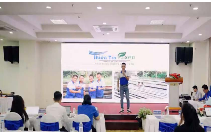
Thí sinh trình bày dự án tại vòng Bán kết khu vực phía Nam

T hông tin từ Ban Tổ chức Cuộc thi Dự án khởi nghiệp thanh niên nông thôn năm 2023, trong số 56 dự án tranh tài tại Vòng Bán kết Cuộc thi khu vực phía Nam, Ban Giám khảo đã lựa chọn 12 dự án xuất sắc nhất tham gia vòng Chung kết.