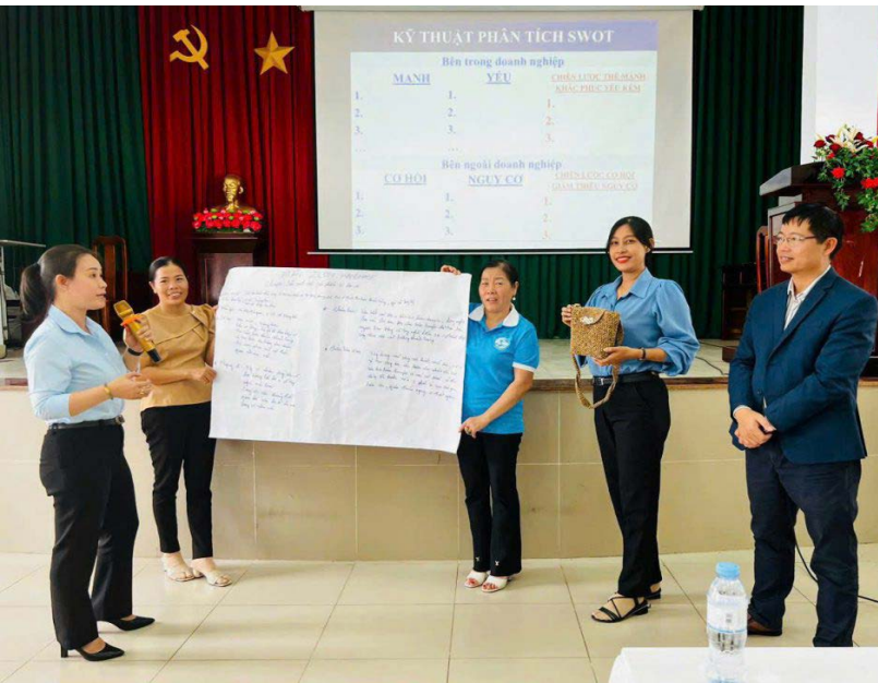
Trình bày, giới thiệu dự án của mình.

Đề án giành cho các đối tượng là phụ nữ, trong đó quan tâm hỗ trợ với phụ nữ có ý tưởng, có nhu cầu khởi nghiệp, các tổ hợp tác/hợp tác xã, doanh nghiệp mới thành lập do phụ nữ làm chủ. Ưu tiên phụ nữ thuộc hộ nghèo, khó khăn, phụ nữ là người dân tộc thiểu số, phụ nữ khuyết tật, phụ nữ sống tại địa bàn khó khăn, địa bàn chuyển đổi đất nông nghiệp.