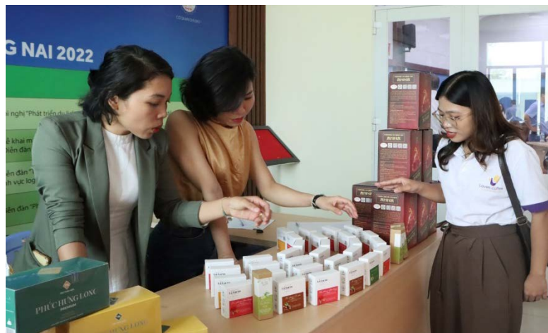
Các sản phẩm từ Cuộc thi KNĐMST tỉnh Đồng Nai trưng bày bên lề hội nghị.

về dự án khởi nghiệp của mình, những khó khăn vướng mắc trong quá trình bắt tay vào khởi nghiệp và những kiến nghị gửi đến các ngành chức năng đề định hướng phát triển trong thời gian tới. Cũng tại hội nghị, đại diện Trung tâm Xúc tiến thương mại đã thông tin về hoạt động hỗ trợ doanh nghiệp nhỏ và vừa nói chung và doanh nghiệp khởi nghiệp tham gia các kênh phân phối trên địa bàn tỉnh trong thời gian qua.