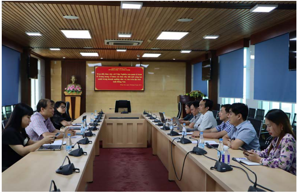
Quang cảnh buổi làm việc.