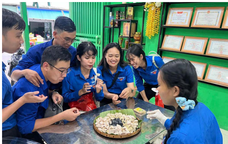
Đoàn viên thanh niên tham quan tại Cơ sở kỹ nghệ tổng hợp Cohafood