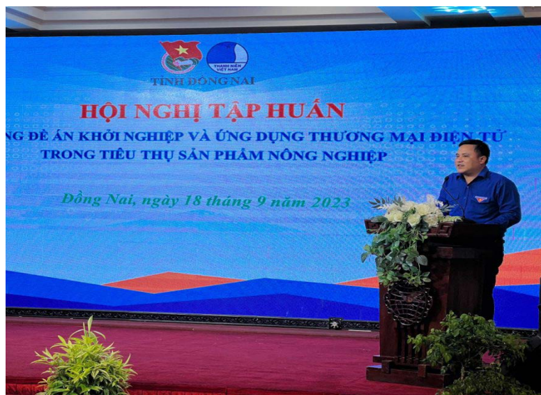
Hội nghị tập huấn nhằm trang bị những kiến thức khởi nghiệp chính cho đoàn viên thanh niên

Đoàn viên thanh niên cũng có cơ hội tìm hiểu về công cụ và chiến lược bán hàng