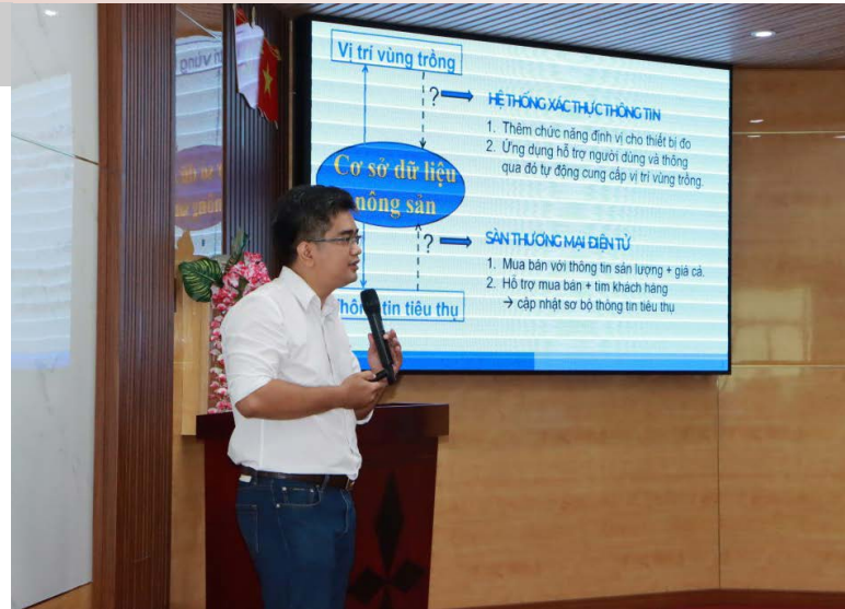
Báo cáo dự án Hệ thống xác thực thông tin tiêu thụ nông sản và vị trí vùng trồng cùng với sàn thương mại điện tử trên địa bàn tỉnh Đồng Nai tại vòng thi thử thách