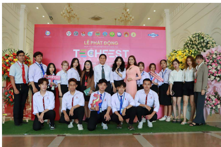
Ngày hội thu hút sinh viên các trường tham gia

Nhằm tổ chức thành công chuỗi sự kiện Ngày hội khởi nghiệp đổi mới sáng tạo tỉnh Đồng Nai – Techfest DongNai 2023 nhằm lan tỏa tinh thần khởi nghiệp, khởi nghiệp đổi mới sáng tạo đến với mọi tầng lớp nhân dân trong tỉnh, Sở Khoa học và Công nghệ xây dựng Kế hoạch triển khai thực hiện Ngày hội khởi nghiệp đổi mới sáng tạo tỉnh Đồng Nai – Techfest DongNai 2023 với nhiều sự kiện sẽ diễn ra trong thời gian tới.