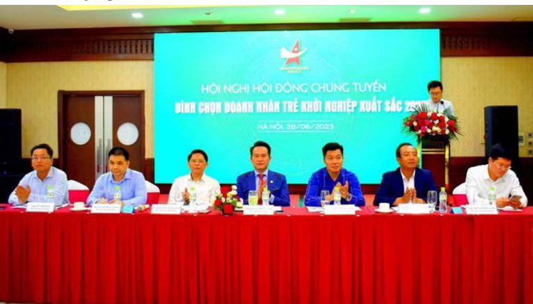
Các thành viên chủ trì hội đồng bình chọn

Vừa qua, Hội đồng bình chọn Doanh nhân trẻ khởi nghiệp xuất sắc 2023 đã chọn ra các ứng viên xuất sắc nhất để trao danh hiệu Top 100 Doanh nhân trẻ khởi nghiệp xuất sắc 2023.