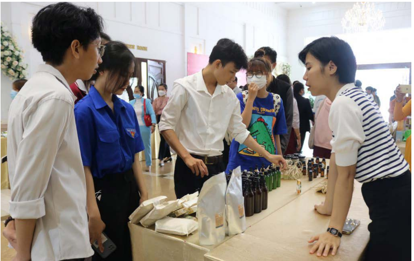
Nhà đầu tư giữ góc nhìn lạc quan về hệ sinh thái khởi nghiệp Việt Nam (trong ảnh: giới thiệu về sản phẩm khởi nghiệp ở Đồng Nai)

ảnh hưởng bởi tác động sâu sắc của cuộc khủng hoảng toàn cầu. Năm 2022, vốn đầu tư mạo hiểm vào Việt Nam giảm mạnh 56% so với năm 2021, nhưng tăng 41% so với năm 2020. Tuy nhiên, số lượng thương vụ tăng lên vào cuối năm cho thấy hoạt động đầu tư vẫn tiếp tục với tốc độ ổn định dù giá trị trung bình mỗi thương vụ giảm đi.