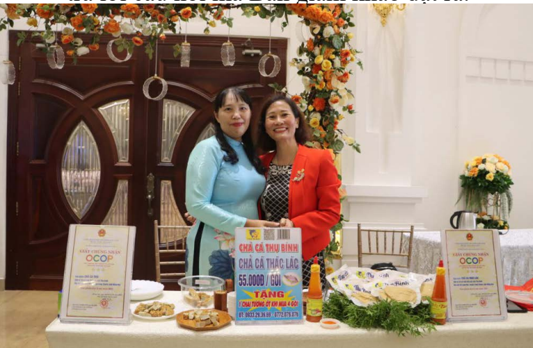
Các gian hàng tham gia cuộc thi năm 2022

Trên cơ sở các bản tóm tắt ý tưởng/dự án mà các thí sinh/nhóm thí sinh gửi về, Ban giám khảo sẽ tiến hành chấm điểm, lựa chọn 15 ý tưởng/dự án có số điểm cao nhất vào vòng bán kết. Các thí sinh/nhóm thí sinh vào vòng bán kết sẽ hoàn thiện nội dung ý tưởng/dự án. Tiếp đến sẽ thuyết trình trực tiếp trước Ban giám khảo về ý tưởng/dự án, cách thức thực hiện và trả lời câu hỏi mà Ban giám khảo đặt ra.