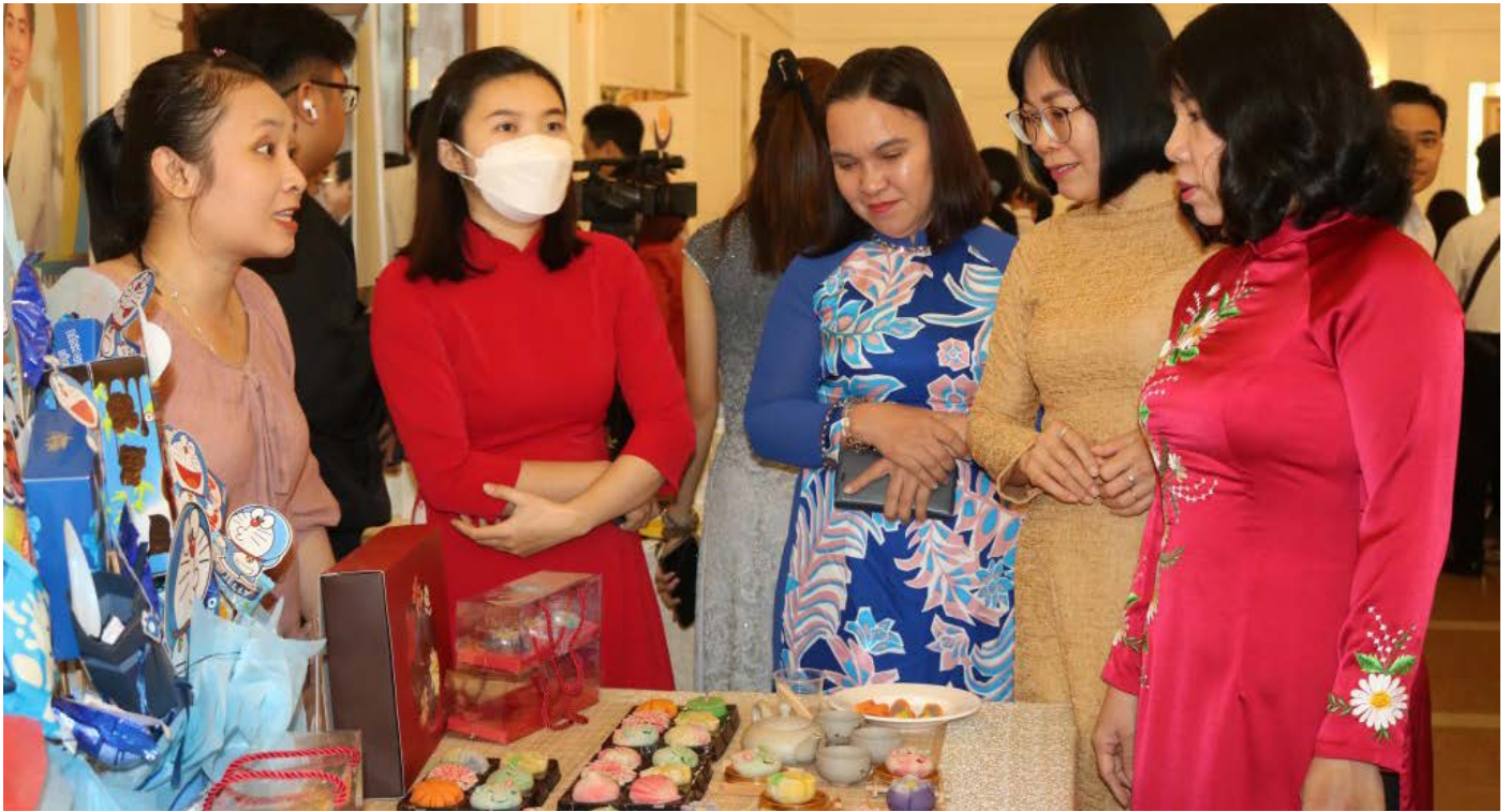
Phụ nữ Đồng Nai năng động làm chủ nhiều mô hình kinh tế

Vừa qua, UBND tỉnh Đồng Nai đã có Kế hoạch số 125/KH-UBND nhằm triển khai, cụ thể hóa các nội dung mà Đề án Hỗ trợ HTX do phụ nữ tham gia quản lý, tạo việc làm cho lao động nữ đến năm 2030 đã đặt ra theo tình hình thực tế tại địa bàn. UBND tỉnh giao nhiệm vụ cụ thể cho các sở, ngành, địa phương. Trong đó, 2 đơn vị là Hội LHPN tỉnh và Liên minh HTX tỉnh có vai trò quan trọng.