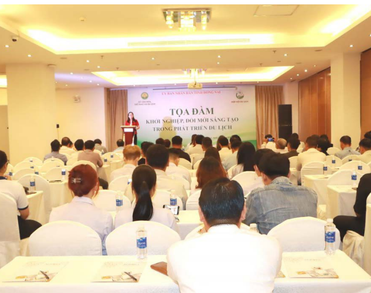
◀ Quang cảnh buổi tọa đàm