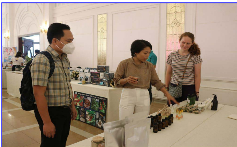
Mô hình khởi nghiệp từ thiên nhiên của phụ nữ huyện Vĩnh Cửu

Theo đó tập trung vào các nội dung chính như: Tuyên truyền, vận động phụ nữ nâng cao nhận thức về hỗ trợ phát triển kinh tế tập thể, Hợp tác xã: Tổ chức hội nghị quán triệt, phổ biến Đề án “Hỗ trợ hợp tác xã do phụ nữ tham gia quản lý, tạo việc làm cho lao động nữ đến năm 2030” và Kế hoạch thực hiện Đề án 01 của UBND tỉnh đến các sở, ban, ngành liên quan, các huyện, thành phố và cán bộ, hội viên phụ nữ trên địa bàn tỉnh. Đổi mới, đa dạng các hình thức tuyên truyền; đẩy mạnh tuyên truyền cho cán bộ, người đứng đầu, cơ quan, tổ chức, hội viên, phụ nữ và người dân về chính sách liên quan hỗ trợ HTX do phụ nữ tham gia quản lý, điều hành, tạo nhiều việc làm cho lao động nữ; phát huy vai trò của phụ nữ trong phát triển KTTT, HTX; thúc đẩy bình đẳng giới trong lĩnh vực kinh tế, việc làm và tham gia các hoạt động xã hội. Xây dựng phóng sự về các điển hình phụ nữ trong phát triển HTX, kết quả thực hiện