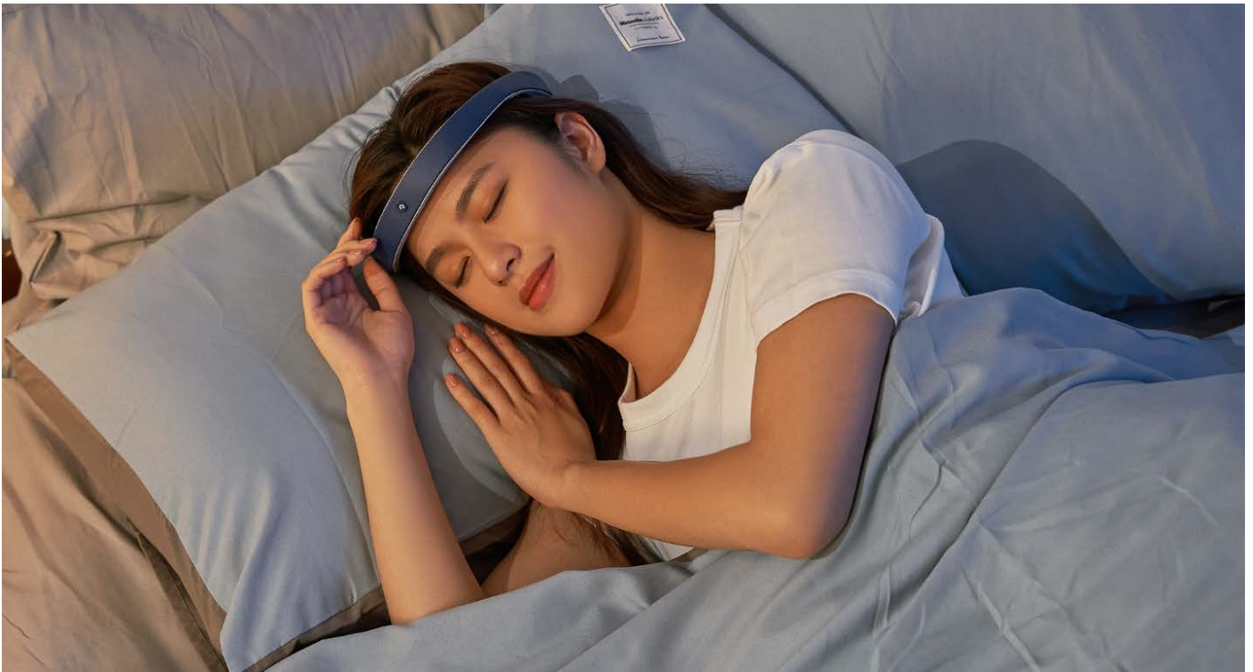
Frenz Brainband

CÔNG TY KHỞI NGHIỆP CÔNG NGHỆ GIẤC NGỦ DÀNH CHO NGƯỜI TIÊU DÙNG EARABLE NEUROSCIENCE VỪA NHẬN ĐƯỢC MỘT KHOẢN TÀI TRỢ KHÔNG ĐƯỢC TIẾT LỘ TỪ ĐƠN VỊ ĐẦU TƯ MẠO HIỂM CỦA SAMSUNG TRONG VÒNG CẦU NỔI.