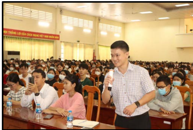
Ảnh hoạt động hỗ trợ khởi nghiệp cho sinh viên tại Đồng Nai

Đội quán quân sẽ có cơ hội hợp tác với các quỹ hỗ trợ khởi nghiệp, các nhà đầu tư và nhiều doanh nghiệp trong cùng lĩnh vực, tham gia vào hệ sinh thái Khởi nghiệp Campus K Ventures. Các