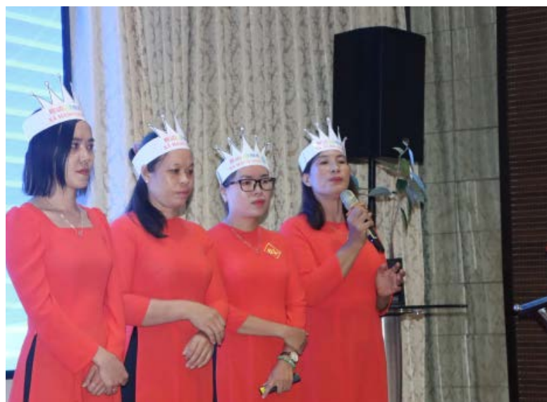
Thí sinh tham gia thuyết trình chung kết cuộc thi phụ nữ Đồng Nai khởi nghiệp năm 2023

Cuộc thi nhằm tìm kiếm các dự án tiềm năng để kết nối đầu tư, giới thiệu quảng bá sản phẩm, xây dựng thương hiệu... thúc đẩy tinh thần khởi nghiệp trong hội viên phụ nữ. Bên cạnh các doanh nghiệp, hợp tác xã, tổ hợp tác, tổ liên kết, hộ sản xuất có đăng ký kinh doanh do phụ nữ làm chủ hoặc tham gia quản lý, cuộc thi còn dành cho các đối tượng và những tác giả chưa đăng ký kinh doanh. Trong đó bao gồm những phụ nữ có ý tưởng/dự án khởi nghiệp mới dự kiến triển khai; phụ nữ yếu thế (khuyết tật, bị ảnh hưởng bởi HIV/AIDS, phụ nữ hoàn lương tái hòa nhập cộng đồng...); nữ học viên, sinh viên đang theo học tại các trường đại học, cao đẳng, giáo dục nghề nghiệp trên địa bàn tỉnh.