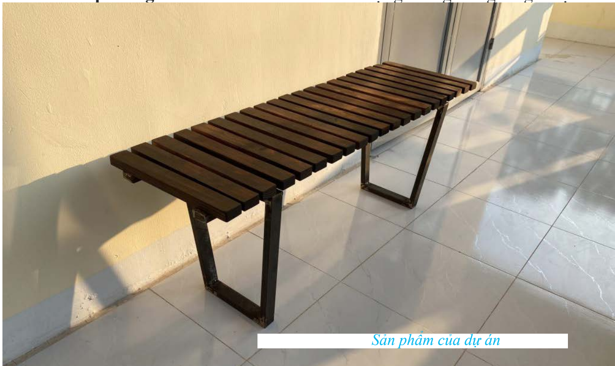
Sản phẩm của dự án

Nhóm nghiên cứu cũng cho biết, nguyên liệu chính để tạo nên sản phẩm gỗ biến tính là các loại gỗ rừng trồng có giá trị