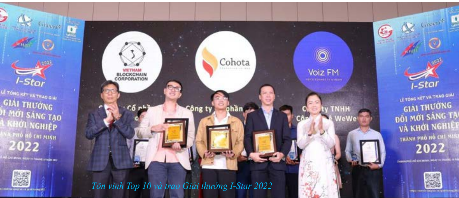
Tôn vinh Top 10 và trao Giải thưởng I-Star 2022