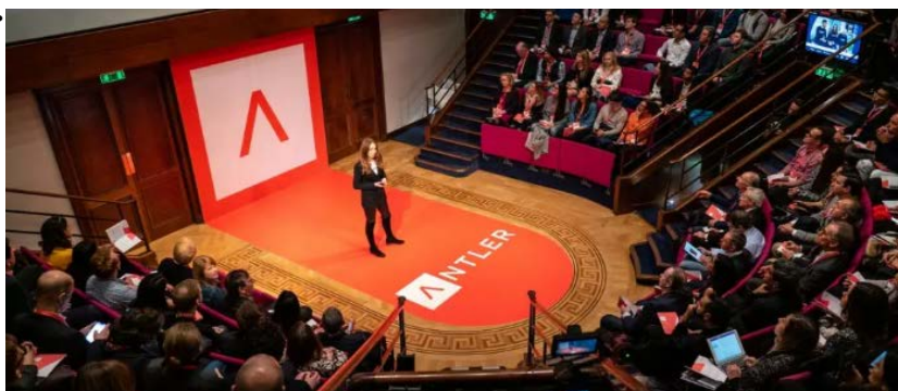
Một chương trình của Antler

Base, một startup chuyên về chăm sóc sức khỏe và sắc đẹp trực tiếp đến người tiêu dùng của Indonesia đã huy động được 6 triệu USD trong vòng gọi vốn series A vào tháng 11 năm ngoái. Công ty là một phần trong chương trình của Antler.