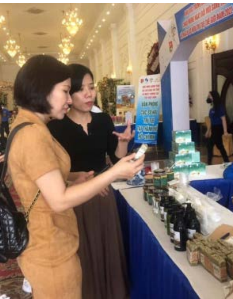
Khách hàng tham quan gian hàng trưng bày giới thiệu sản phẩm của Lá Farm