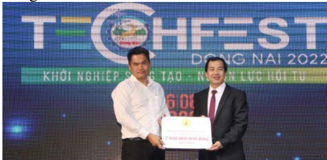
Hội Doanh nhân trẻ tỉnh Đồng Nai trao bằng tượng trưng hỗ trợ 2 tỷ đồng cho Quỹ đồng hành cùng startup Đồng Nai